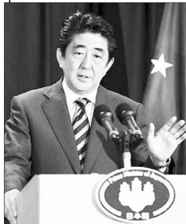
Прем’єр-міністр Японії Сіндзо Абе хоче затвердити право Японії на колективну самооборону та можливість країни прийти на допомогу іншому народу за певних обставин. Про це повідомляє defense-news.com. Такий крок, міг би дозволити докорінно змінити потенціал сил самооборони Японії та підтримувати баланс сил в регіоні на противагу зростаючій потужності Китаю.

Відповідно до рішення уряду вже створена відповідна робоча група, яка напрацьовує зміни до основного закону країни. Відповідно до діючого законодавства можливість участі Японії в інститутах колективної безпеки суворо обмежена. Країна має лише право на індивідуальну оборону, до того ж, за умов наявності мінімальних сил, необхідних для її забезпечення.